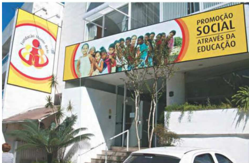
A Fundação faz a diferença para 77.813 famílias atendidas e beneficiadas anualmente na Grande Vitória

ATRAVÉS DA PARCERIA COM AS INICIATIVAS PRIVADA E PÚBLICA, A FUNDAÇÃO MONTE BELO DESENVOLVE PROJETOS EDUCACIONAIS E DE CAPACITAÇÃO